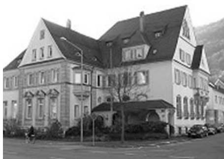
EDV-mäßig mit dem Landratsamt verbunden: Landwirtschaftsamt Göppingen und Vermessungsamt Geislingen

Verhandlungen mit der Stadtverwaltung Göppingen konnte doch noch ein Kabelweg zur Verlegung eines Glaskabels erhoben werden. Im Juni 2005 konnte diese Maßnahme realisiert und abgeschlossen werden, so dass ab diesem Zeitpunkt auch dort eine sehr gute Anbindung zur Verfügung gestellt werden konnte.