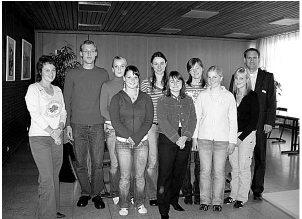
Auftaktveranstaltung zum Sozialen Lernen im Oktober 2006 mit Azubis der Stadt Göppingen