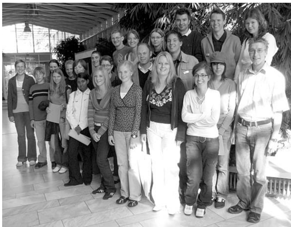
Die neuen Auszubildenden beim Rundgang durchs Haus im September 2006

Im Jahr 2007 ist erstmals ein sogenannter „Ausbildungs-Knigge-Kurs“ geplant. Hier sollen den Azubis grundlegende Verhaltensweisen und Hilfestellungen für ihre tägliche Praxis vermittelt werden