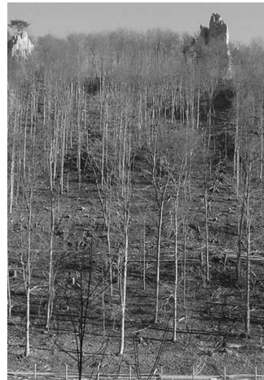
Waldbestand nach dem Hieb mit freigestellten Felsen

ein neues, viel ursprünglicheres Landschaftsbild im Tal ergeben. Die Maßnahme machte, wie das Bild mit dem Bagger zeigt, eine Vollsperrung der Steinenkircher Steige notwendig. Der Verkehr wurde in der Zeit über Waldhausen umgeleitet. Der öffentliche Personennahverkehr konnte mit zusätzlichen Fahrzeugen auch über die Umleitung weiter gewährleistet werden. Das gesamte Projekte zum Schutz von Mensch und gefährdeten Biotopen war mit hohem personellen und finanziellen Aufwand verbunden. Nach Abzug der Erlöse für das verkaufte Holz bleiben beim Land Baden-Württemberg als Waldbesitzer noch mehr als 150.000 Euro Defizit.