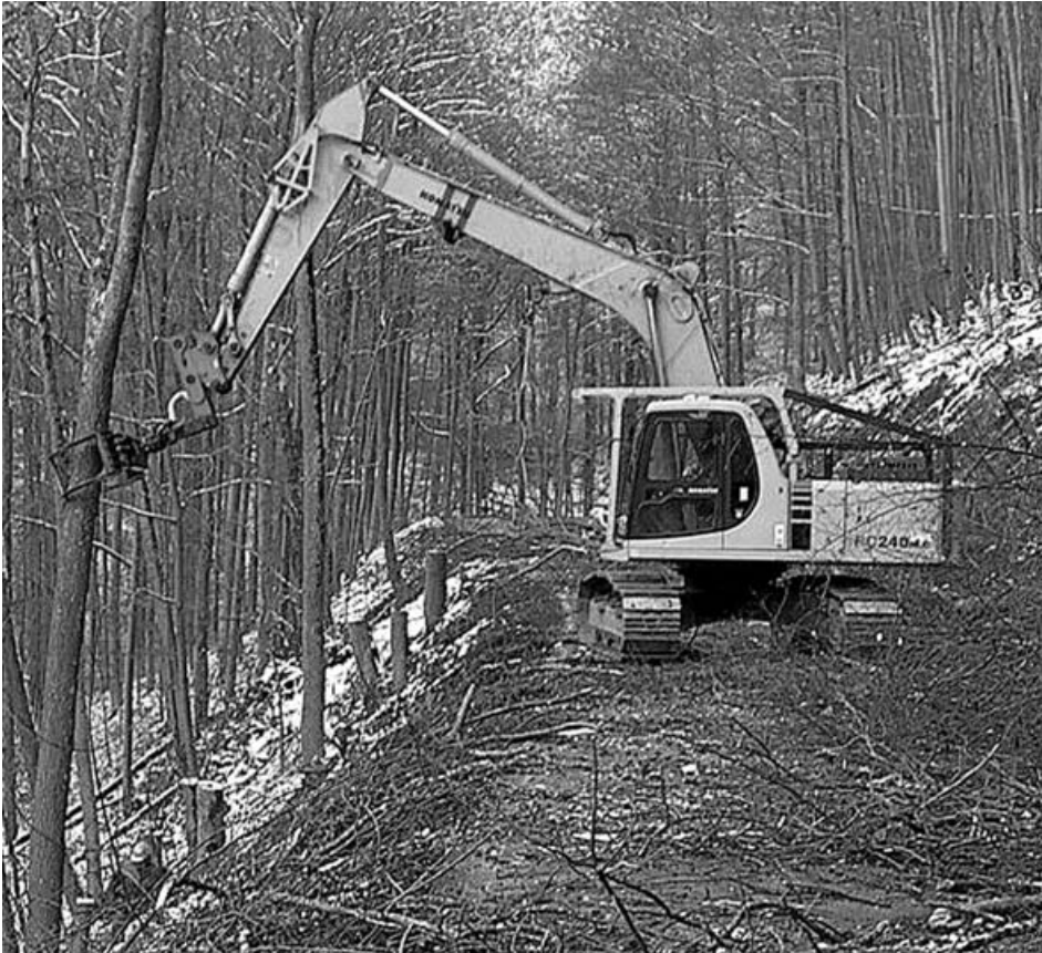
Spezial-Bagger zur Unterstützung beim Fällen am Steilhang

Die Steinenkircher Steige im Roggental zwischen Eybach und Steinenkirch war im November und Dezember 2005 Schauplatz einer spektakulären Maßnahme der Waldpflege. In den letzten Jahren erhöhte sich immer mehr das Gefährdungspotenzial für den Verkehr im Roggental. Bäume und abgestorbene Äste drohten auf die Straße zu fallen. Das Hauptaugenmerk der Aktion lag auf der Herstellung der Verkehrssicherheit auf der Steige nach Steinenkirch und der Roggentalstraße nach Treffelhausen. In einer konzentrierten Aktion wurde innerhalb von knapp fünf Wochen über 8.000 Festmeter