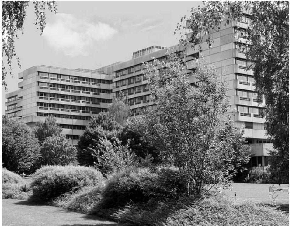
Klinik am Eichert Göppingen

Das GKV-Gesundheitsreformgesetz 2000 stellte die Krankenhäuser vor signifikante Veränderungen und neue Herausforderungen. Kern ist ein pauschalisiertes Entgeltsystem bei dem die Abrechnung der stationären Krankenhausleistungen nach diagnose-orientierten Fallpauschalen (DRGs = Diagnosis Related Groups) erfolgt. Die Relativgewichte (Preise) für diese DRGs werden dabei anhand von Patienten- und Kostendaten deutscher Krankenhäuser kalkuliert. Im Verlauf einer mehrjährigen Konver-