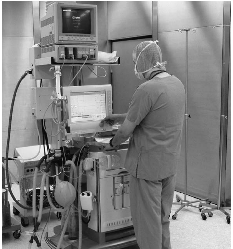
Im Operationssaal der Klinik am Eichert