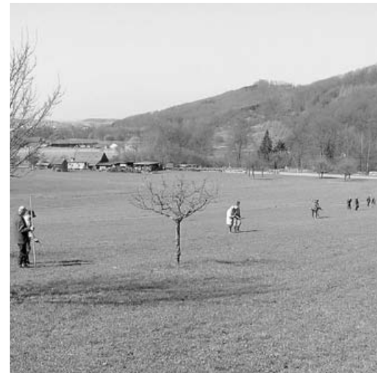
Fünf landwirtschaftliche Sachverständige mit Bohrgehilfen bei der Bewertung im Gelände.

Die Wertermittlung der landwirtschaftlichen Grundstücke dient zugleich als Grundlage für die gleichwertige Zuteilung von Flächen an die einzelnen Teilnehmer.