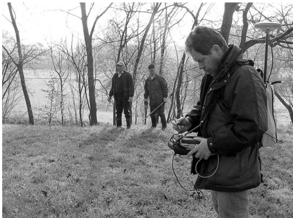
Ein Vermessungstechniker der Flurbereinigungsbehörde dokumentiert das Ergebnis der Wertermittlung mit modernster Technik (elektronisches Feldbuch verbunden mit GPS-Empfänger).

Nach Unanfechtbarkeit des Flurbereinigungsbeschlusses erließ die untere Flurbereinigungsbehörde am 8.08.2006 die Vorläufige Anordnung nach § 36 Flurbereinigungsgesetz für den 1. Bauabschnitt. Mit dieser Anordnung wurde den Eigentümern bzw. den Bewirtschaftern ab 1.09.2006 Besitz und Nutzung der für die Straße benötigten Flächen entzogen und dem Landkreis zugewiesen. Zugleich setzte die Flurbereinigungsbehörde die Entschädigungen für die entgehenden Erträge und die auf diesen Flächen stehenden Bäume und Bauwerke auf der Grundlage von Gutachten externer Sachverständiger fest und veranlasste deren Auszahlung. Anfang September 2006 haben die von der Stadt beauftragten Baufirmen mit den Straßenbauarbeiten begonnen.