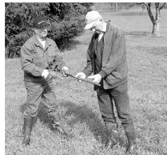
Ein landwirtschaftlicher Sachverständiger (rechts) klassifiziert den Boden an Hand des Bodengefüges im Bohrstock.