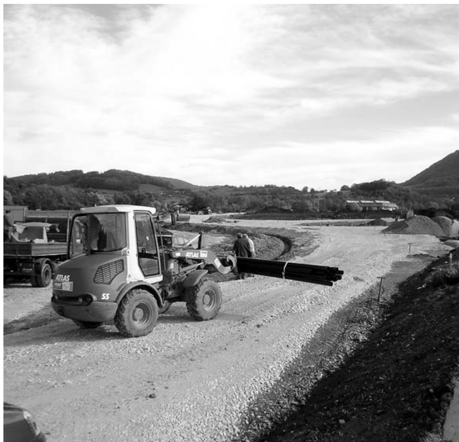
Umgehungsstraßenbau im Herbst 2006

Nach Unanfechtbarkeit des Flurbereinigungsbeschlusses erließ die untere Flurbereinigungsbehörde am 8.08.2006 die Vorläufige Anordnung nach § 36 Flurbereinigungsgesetz für den 1. Bauabschnitt. Mit dieser Anordnung wurde den Eigentümern bzw. den Bewirtschaftern ab 1.09.2006 Besitz und Nutzung der für die Straße benötigten Flächen entzogen und dem Landkreis zugewiesen. Zugleich setzte die Flurbereinigungsbehörde die Entschädigungen für die entgehenden Erträge und die auf diesen Flächen stehenden Bäume und Bauwerke auf der Grundlage von Gutachten externer Sachverständiger fest und veranlasste deren Auszahlung. Anfang September 2006 haben die von der Stadt beauftragten Baufirmen mit den Straßenbauarbeiten begonnen.