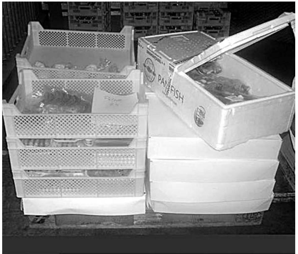
Gefrorenem Fleisch sind geruchliche Abweichungen auf den ersten Blick nicht anzumerken.

sungspflicht für alle Unternehmen, die mit tierischen Lebensmitteln umgehen, festgeschrieben, die mit vermehrten Anforderungen an die Unternehmer und an die Überwachung verknüpft ist. Weiterhin wird in der Gesetzgebung der Schnittstelle „Lebensmittel/kein Lebensmittel (mehr)“ verstärkt Beachtung geschenkt, so dass die