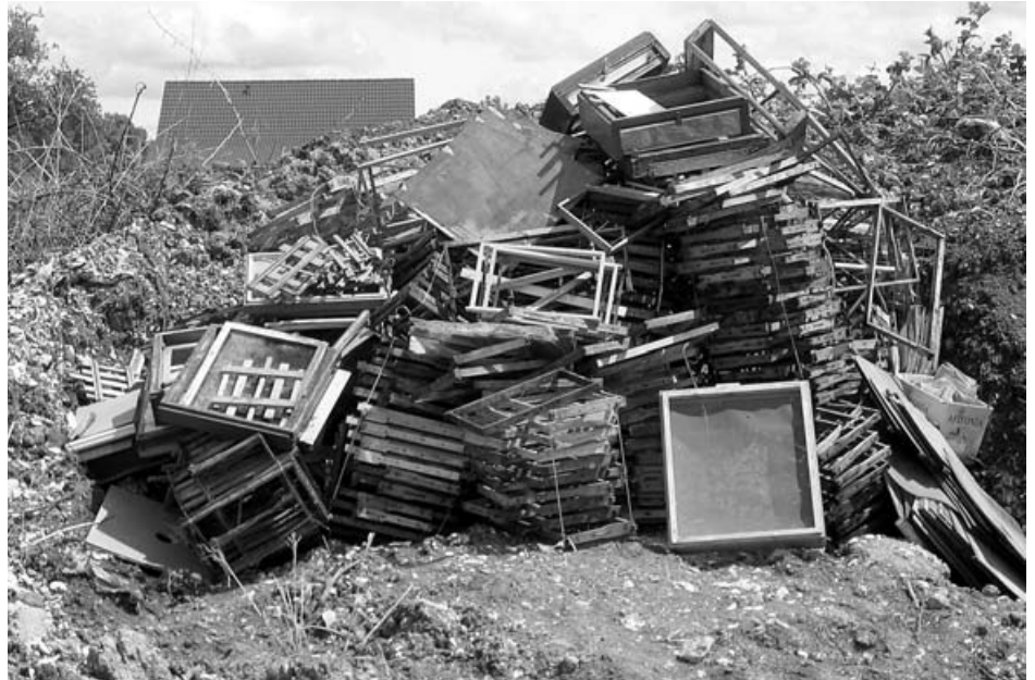
Imkerutensilien, die im Betrieb nicht leicht gereinigt und desinfiziert werden können ...

Die Amerikanische oder Bösartige Faulbrut ist eine ansteckende gefährliche Bienenseuche, die erneut im Sommer 2005 auf der Gemarkung Göppingen und im Frühjahr 2006 auf der Gemarkung Eisligen festgestellt wurde. Die betroffenen Bienenstände wurden sofort gesperrt. Weiterhin wurden Sperrbezirke mit ca. 1 Kilometer Durchmesser gebildet und öffentlich bekannt gemacht. Durch die Untersuchung sogenannter Futterkranzproben ist heutzutage eine erfolgreiche Bekämpfung der Seuche durch differenziertes Vorgehen möglich. Innerhalb kürzester Zeit wurden alle Bienenvölker im Sperrbezirk untersucht. Die Bösartige Faulbrut wird meist von bereits unerkannt infizierten Bienenstöcken übertragen. Der Erreger ist ein sporenbildendes Bakterium. Dieses befällt ausschließlich die Bienenbrut. Die Bakterien vermeh-