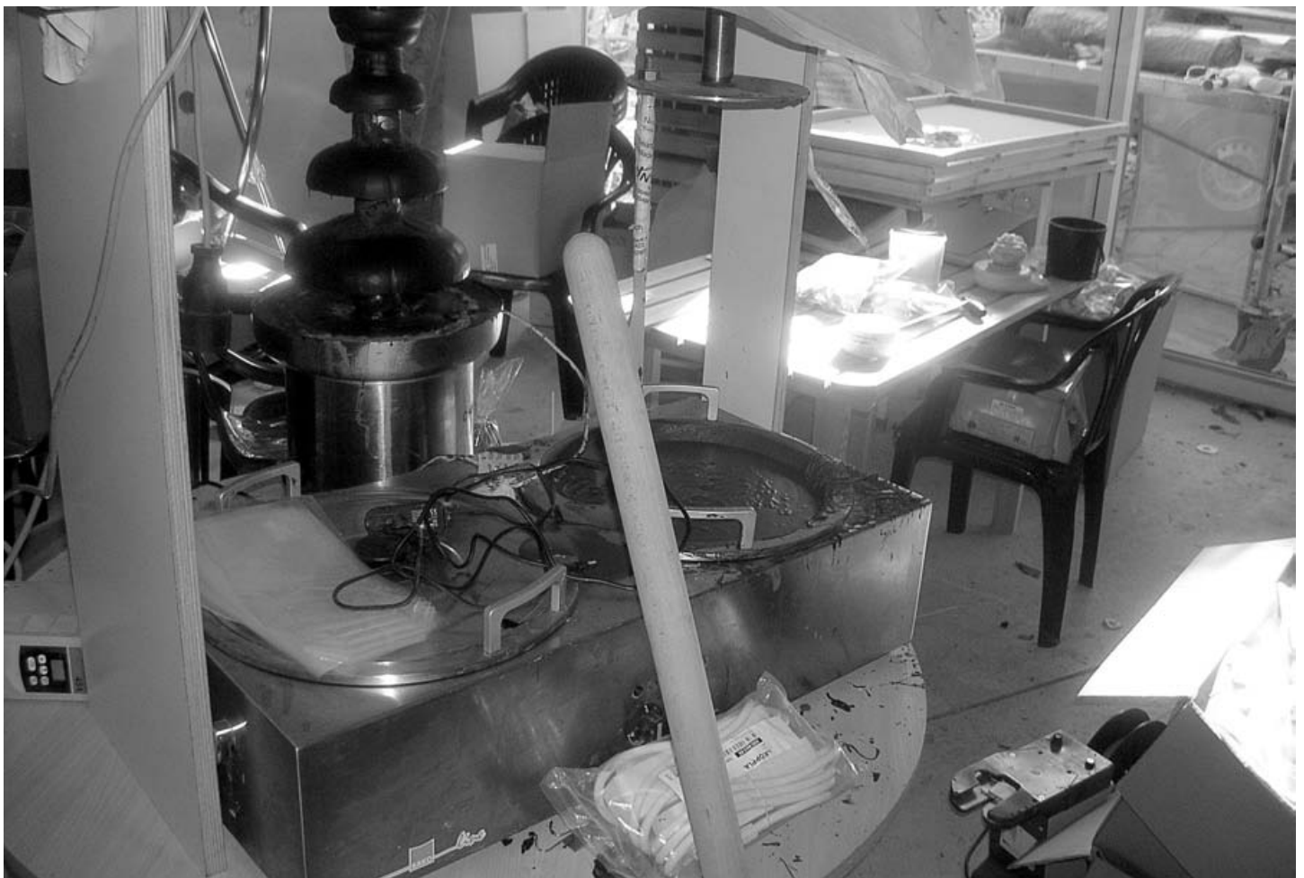
Produktion von Schoko-Apfelscheiben in völlig unzureichender baulicher und hygienischer Produktionsstätte. Eine Probe davon wird beanstandet.

Bei etwas mehr als 800 Proben gab es keine Beanstandungen. Bei über 100 Proben jedoch waren Folgemaßnahmen notwendig, die auch zur Anzeigenerstattung führten.