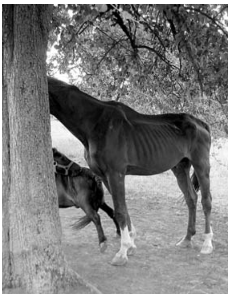
Hochgradig abgemagertes, verwaorlostes Pferd.

In den Jahren 2005 und 2006 wurden durch das Amt für Veterinärwesen und Verbraucherschutz Göppingen aufgrund grober tierschutzrechtlicher Verstöße 4 Tierhaltungen aufgelöst und ein Tierhalteverbot ausgesprochen. Weiterhin wurden in den Bereichen landwirtschaftlicher Nutztiere sowie Heimtierhaltung ca. 25 kostenpflichtige Anordnungen und Ordnungswidrigkeitanzeigen erlassen. Im Jahr 2005 fand unter Beteiligung der Polizeihundestaffel Waiblingen eine Verhaltensprüfung für Kampfhunde statt. Die weitaus überwiegende Zahl von angezeigten Verstößen in der Nutztier- und Heimtierhaltung erwiesen sich bei fachlicher Überprüfung der zuständigen amtlichen Tierärzte als unbegründet bzw. als reine Nachbarschaftsstreitigkeiten.