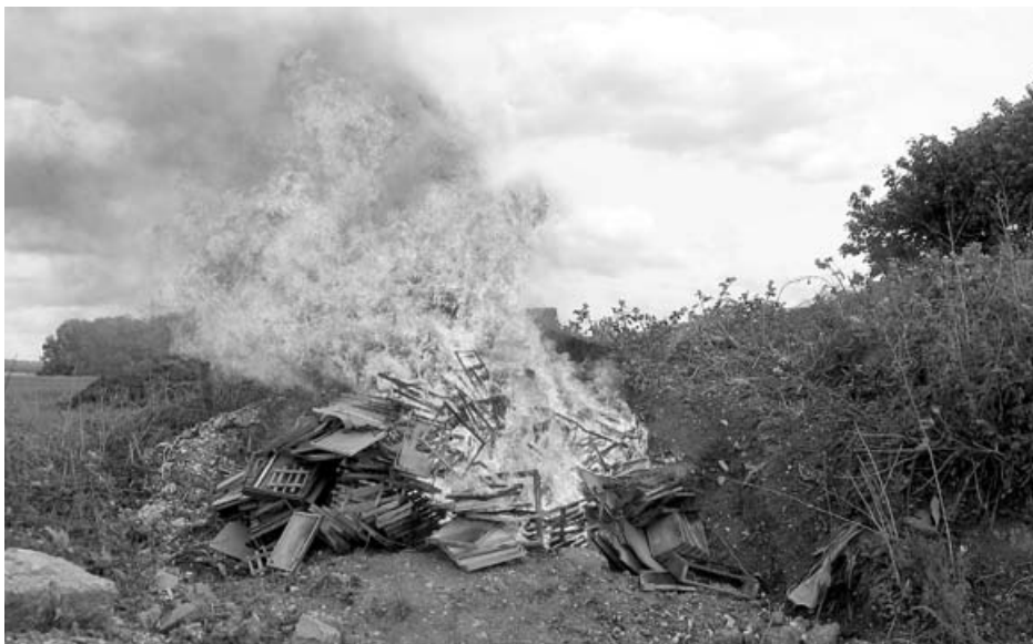
... werden wenn möglich direkt vor Ort unschädlich gemacht.

Diagnostik werden mit einem Streichholz verdächtige Waben gelöchert. Verdächtig sind eingesunkene Zelldeckel und ein lückenhaftes Brutbild. Erwachsene Bienen können nicht an Faulbrut erkranken, verbreiten aber die Sporen beispielsweise mit ihrem Haarkleid oder als Ammenbienen über das Futter. Sie führen so die Infektionskette fort. Erkrankte Bienenvölker werden durch Abschweifung getötet. Für jedes getötete Bienenvolk einschließlich verbrannter Waben und anderer Materialien gibt es eine Entschädigung über die Tierseuchenkasse Baden-Württemberg. Beim Ausbruch im Frühjahr 2006 mussten in einer Imkerei alle 47 Bienenvölker durch das Veterinäramt unter Mithilfe des Bienensachverständigen getötet werden.