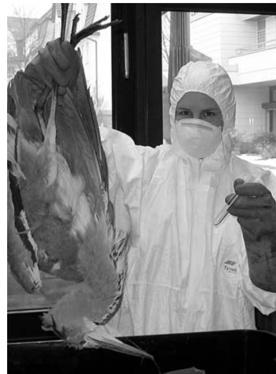
Tupferprobenentnahme bei einem Reiher

Das Aufstallgebot gilt auch im Frühjahr 2007 noch für ganz Baden-Württemberg, wobei die Ausnahmeregelung für eine Freilandhaltung im Landkreis Göppingen weiterhin gültig ist. Im Rahmen der Vorbereitung auf einen befürchteten Ausbruch der Vogelgrippe im Landkreis Göppingen wurde im Stauferpark ein Logistikzentrum eingerichtet. Dort stehen Materialien und Räumlichkeiten zur Verfügung, die im Seuchenfall genutzt werden können.