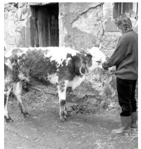
Im Entwicklungszustand zurückgebliebene, abgemagerte 4-jährige Kuh aus einer nicht artgerechten Rinderhaltung.