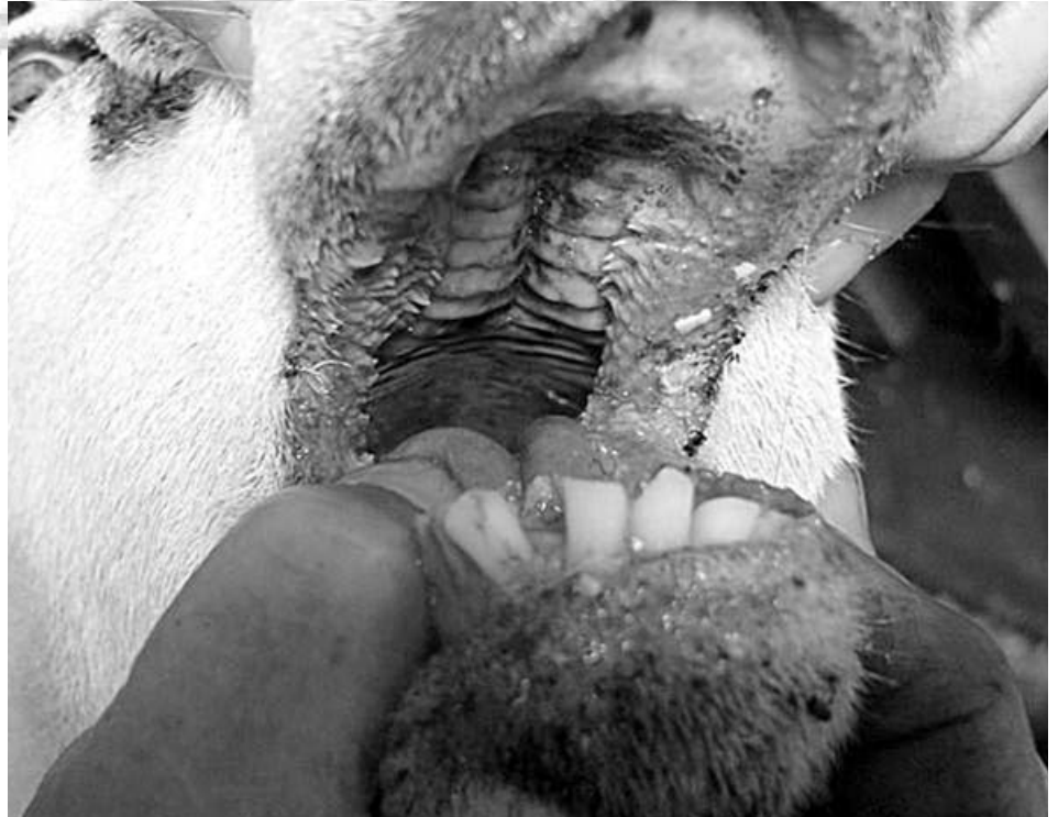
Die Übertragung der Krankheit erfolgt über die Stechmücke.

Erstmals ist 2006 in Deutschland die sogenannte Blauzungkrankheit (engl. Bluetongue BT) aufgetreten – eine Tierseuche, die bislang nur in den Tropen und Südeuropa vorkam. Erstmals breitet sich die Krankheit jetzt auch in Mittel- und Westeuropa aus. In Deutschland sind hauptsächlich die Bundesländer Nordrhein-Westfalen und Rheinland-Pfalz betroffen. Von der Krankheit befallen werden Wiederkäuer wie Schafe, Ziegen und Rinder sowie Wildwiederkäuer. Kranke Tiere zeigen hohes Fieber, Leistungsabfall und Schäden an Klauen, Euter und Schleimhäuten. Typisch ist auch eine Blauverfärbung der Zunge, die der Krankheit ihren Namen gab. Selten endet die Krankheit tödlich. Der Mensch ist für den Erreger nicht empfänglich und somit auch nicht gefährdet. Die Blauzungkrankheit wird durch Stechmücken ( Culicoides ) übertragen. In Baden-Württemberg wurden vorbeugende Kontrollen durchgeführt. Auch im Landkreis Göppingen wurden Rinder- und Schafhaltungen stichprobenartig kontrolliert. Bisher wurden im Landkreis noch keine infizierten Tiere festgestellt. Es ist zu befürchten, dass durch die Klimaerwärmung bessere Lebensbedingungen für die übertragenden Stechmücken geschaffen werden und die ursprünglich tropische Krankheit auch bei uns heimisch wird.