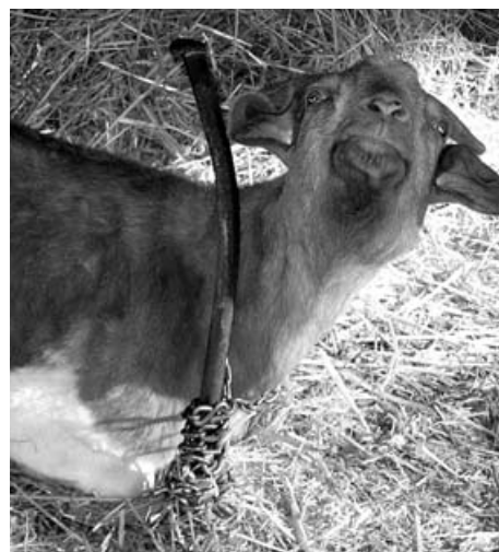
Nicht artgerechte Ziegenhaltung. Die Ziege hat sich mit ihrer Anbindung verfangen und ist in ihrer Bewegung hochgradig eingeschränkt.