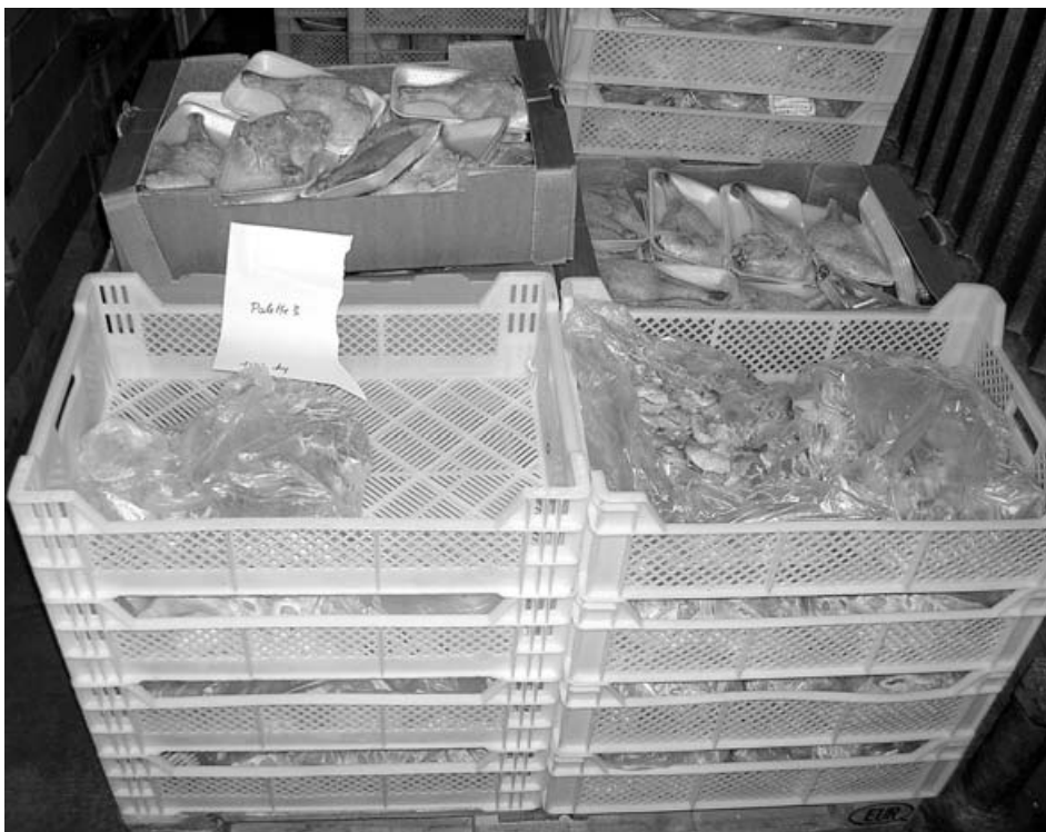
Hähnchenteile und Putenteile mit Gefrierbrand

Bei 84 Kühl- und Gefriertruhen, die schwerpunktmäßig an einem Tag überprüft wurden, war die Funktionalität der meisten Truhen